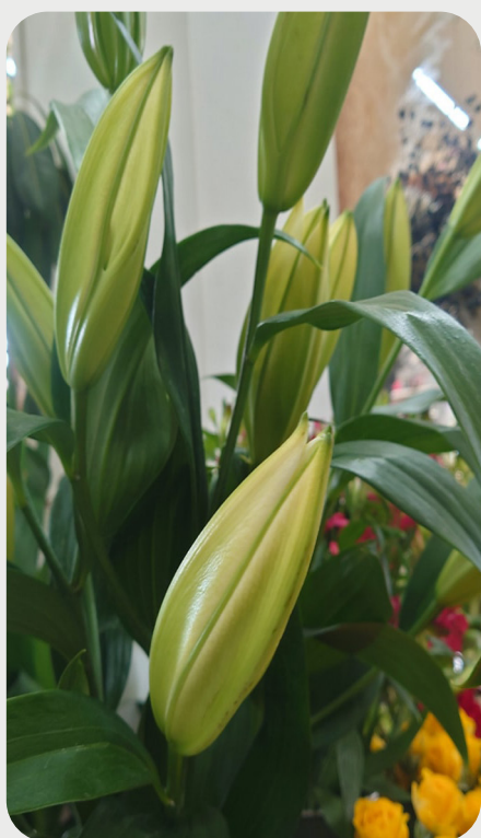
1/20 #lovelilyambassador 青木隆博 寒さも厳しくなり、ユリもじっくりじっくり咲いてくる長く楽しめる季節です。 花が大きく、咲くのが楽しみです。 品種名：トゥモロー