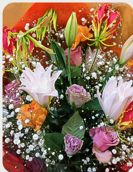
1/28 #lovelilyambassador 辻沙和子 本来ユリは初夏の花。実際は周年出回ってます それってホントはもの凄いこと 冬にユリを飾るときは最後まで楽しんでもらえるように、ある程度温度の高いところで飾っていただくことをお客様に提案しております 品種名：アミスタッド