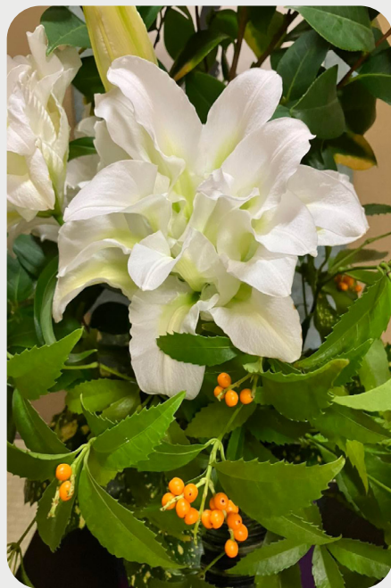
1/7 #lovelilyambassador 金子吉進 明けましておめでとうございます。 八重ユリとグリーン系のコントラスト… お似合いです。 品種名：ローズリリー・アイシャ