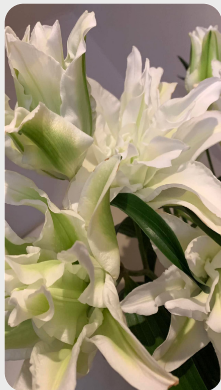
1/9 #lovelilyambassador 永井宏明 緑色の発色が、他の花と合わせやすく 様々な場面に提案できます。 リピート率も高いです。 品種名：ローズリリー アイシャ