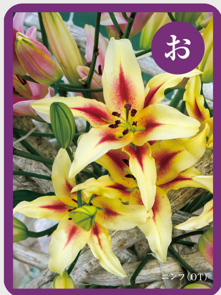
[お] OTハイブリッド 特徴的な ユーカリの 香りの成分