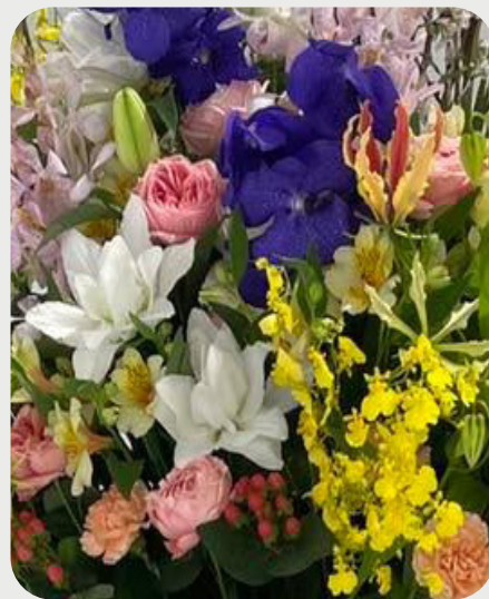
1/14 #lovelilyambassador 齊藤哲裕 八重のユリ「シャルドネ」 お祝いスタンドにもすぐに使えて豪華に見えます。 品種名：シャルドネ