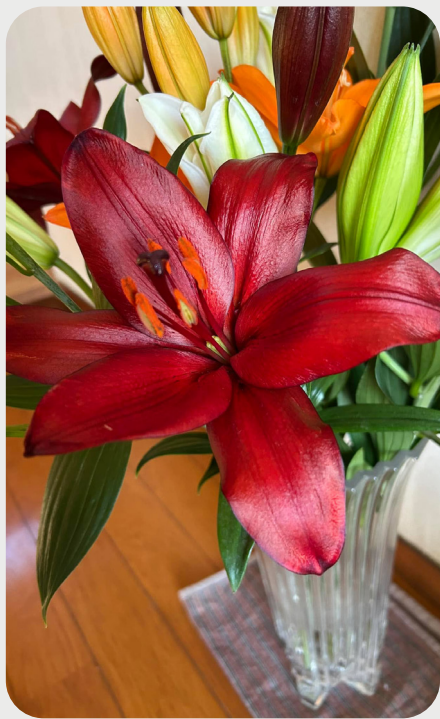
1/5 #lovelilyambassador ハツ田善彦 新しい年の空間を真紅のユリが彩ります。 品種：エスケープ