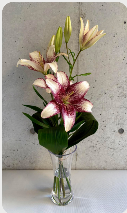
1/24 #lovelilyambassador 濱田達也 単独でもチームになってもかっこいい存在感のあるこのユリは素敵です。 品種名：スイートザニカ