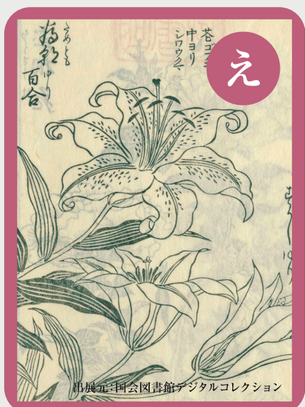
[え] 江戸時代 ユリの育種は スカシユリから