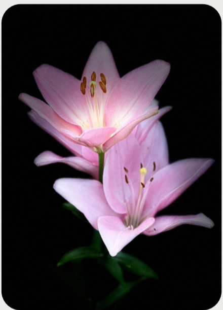
8/16 #lovelilyambassador 池野博聡 暑い夏が続く列島、種類ある花の中でもユリ類は水揚げに優れた特性を持つので、この季節おすすめの花です。 LAユリは夏でも発色してくれるので重宝されます。 こちらは最も有名な作曲家のひとりである彼の名前を冠するユリです。 品種：チャイコフスキー