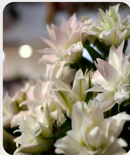
8/14 #lovelilyambassador 齊藤哲裕 お盆です。 お盆のお花に大活躍です。 淡いピンク系で小中輪系の八重のユリなので、使い方に幅が広がります。 品種名：アミスタッド