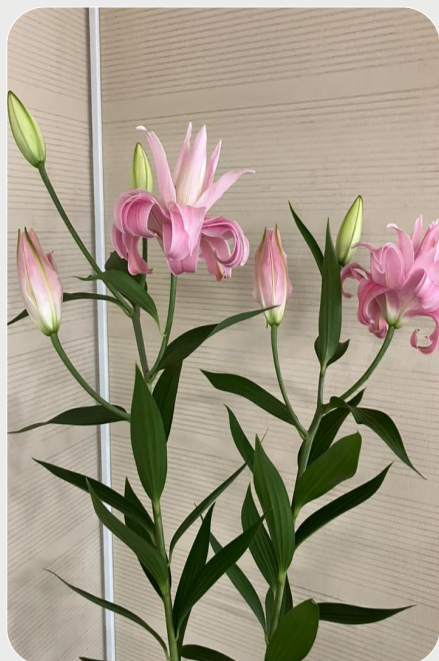
8/12 #lovelilyambassador 岸宏行 中輪の八重ユリ。定番品種になって来たけど、近年の高温のせいか？咲き方が…一番花を越えて二番花が先に咲いた。この後一番花も咲きましたよ。この様な変わった特徴もユリだから楽しめるのかもしれない。 品種名：ディアンサ