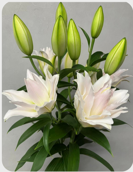
8/5 #lovelilyambassador 金子吉進 八重ユリは酷暑に強い品種が多く大輪から中小輪系まで品種も年々多くなっています。 品種名：アミスタッド