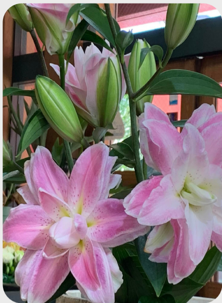
8/9 #lovelilyambassador 永井宏明 暑い夏にも花持ち良く、優しい色あいが人気の的です。 品種名：アコレード