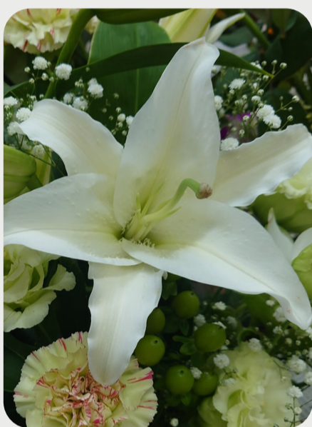
8/20 #lovelilyambassador 青木隆博 お盆は終わってしまいましたが、お供え事にもユリは欠かせません。いつでも大活躍です。 品種名：シベリア