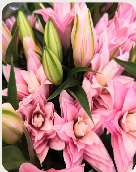
8/28 #lovelilyambassador 辻沙和子 十二単衣のように綺麗な八重。花弁の重なりが他の八重咲きとは違う感じで、幾何学模様を思わせる。ゴージャスで可憐な咲き方をしております。小振りでも愛らしいので使いやすいと思います。 品種名：ディアンサ