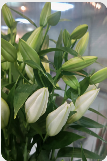
7/28 #lovelilyambassador 辻沙和子 ジワジワと人気上昇中の『無花粉』のユリ 薬は付いてますが花粉が出ないということで「無花粉のユリある？」と人気ですが、まだまだ数が少ないので出会えたら即手に入れて欲しいユリの1つです 品種名：リバーズノー