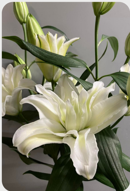
7/6 #lovelilyambassador 金子吉進 暖地産→高冷地産のステージとなり八重ユリ品種も豊富に…各品種特性があり蕾からは想像出来ない開花までの魅力が楽しめます。 品種名：ローズリリー・エシリア(エチリア)