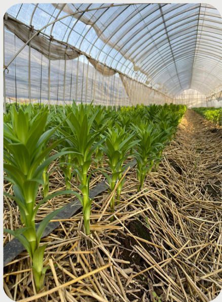
7/6 #lovelilyambassador ハツ田善彦 暑さに負けずに懸命に成長を続けるユリ。 我々もできる限りの手助けをしながら、仕上がるまで見守ります。