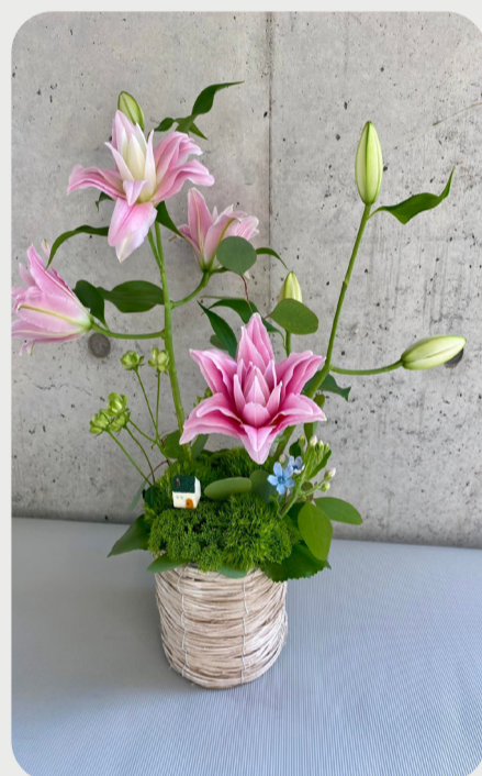
7/24 #lovelilyambassador 濱田達也 暑い日が続くので少しでも涼しく見えたらいいなと八重のゆりを使ってアレンジしてみました。 品種名：カダンゴ