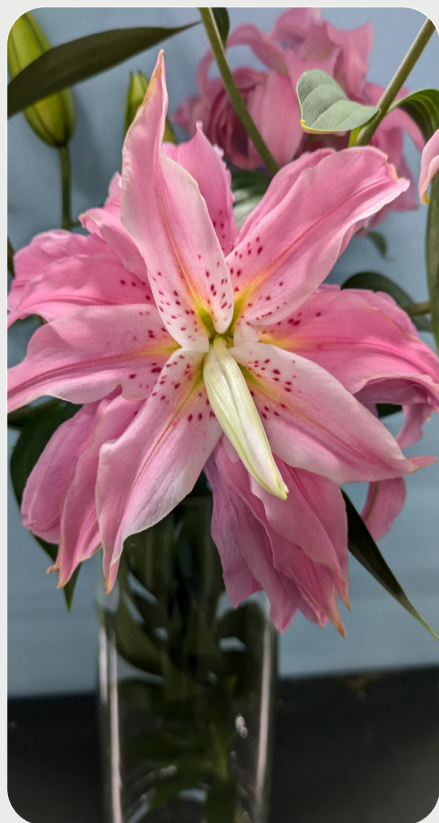
7/8 #lovelilyambassador 赤井祐作 道内産の八重ユリも増えてきましたね！ 品種名：ダイアンサ