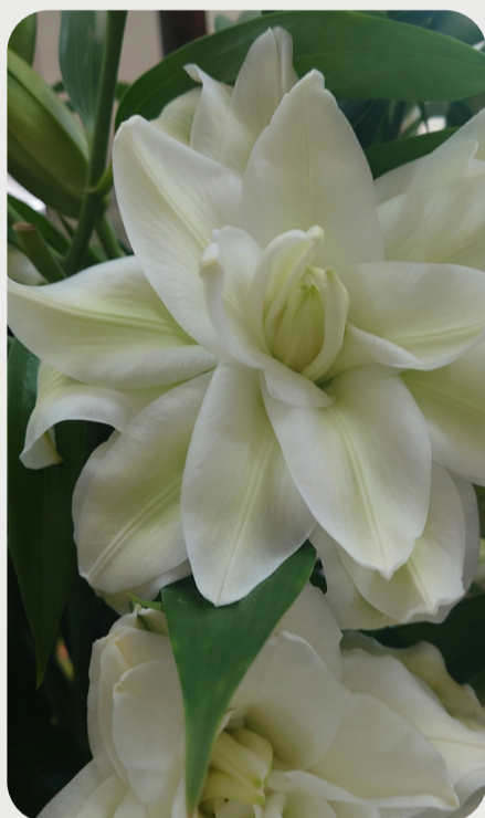
7/20 #lovelilyambassador 青木隆博 うねったような花弁。薄いグリーンは咲くほどに白くなっていきます。日が経つにつれ少しずつ違った表情を楽しめます。 品種名：フォンデュ