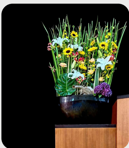
7/14 #lovelilyambassador 齊藤哲裕 暑くなつてまいりましたね。 爽やかさを演出する白いオリエンタルユリ。白が暑さを忘れさせてくれます。今日は「シベリア」です。 品種名：シベリア