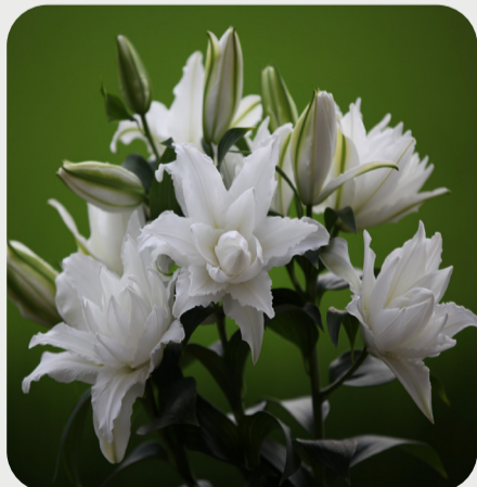
7/25 #lovelilyambassador 小池一構 毎日記録的な暑さが続きますが上を向いた蕾からは力強さを。開花した純白の花弁は一瞬の涼しさすら感じさせてくれます。 品種名：ホワイトトルネード