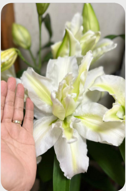
7/12 #lovelilyambassador 岸宏行 小さな球根を一年日本の気候の中で育てて翌年にユリ切花として育てて出荷されたのが国産球根ユリ。この八重ユリも国産球根で生産されたもの。特に季咲きだから品質も良くボリュームが凄い。花保ちも非常に良いです。 品種名：国産アイシャ